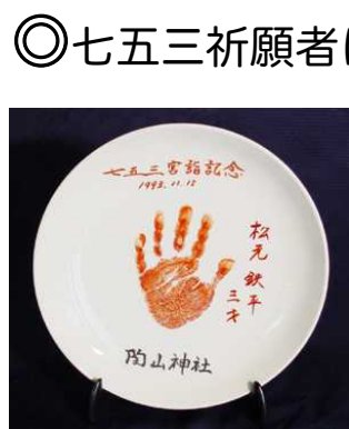
プレゼントの丸皿

◎七五三祈願者に、子供さんのかわいい手形を押した記念皿のプレゼントも恒例になり、子供の心に残る一生の思い出になると大変評判です。