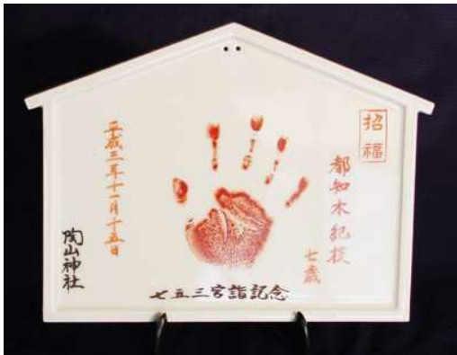
プレゼントの陶板