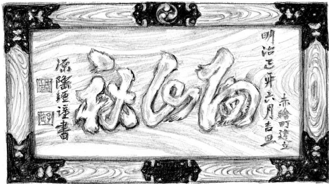
陶山神社拝殿正面の扁額 明治12年中林梧竹揮毫 スケッチ 深川 巖氏