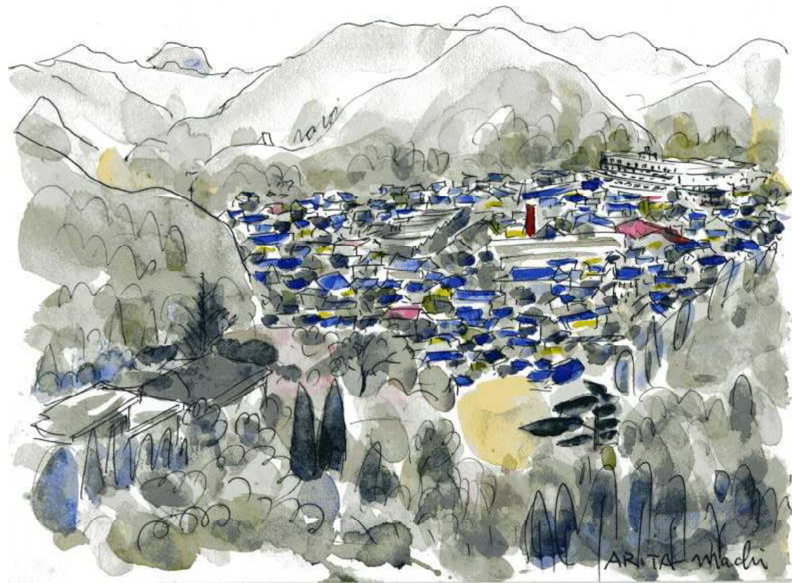
陶山神社裏公園の蓮華石山から見た有田の風景 スケッチ 深川 巖氏