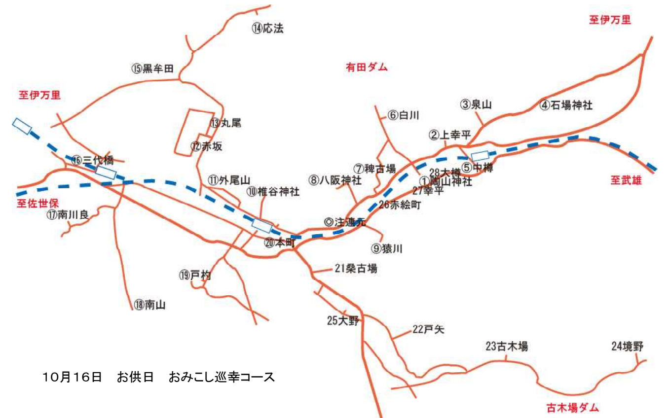
10月16日 お供日 おみこし巡幸コース