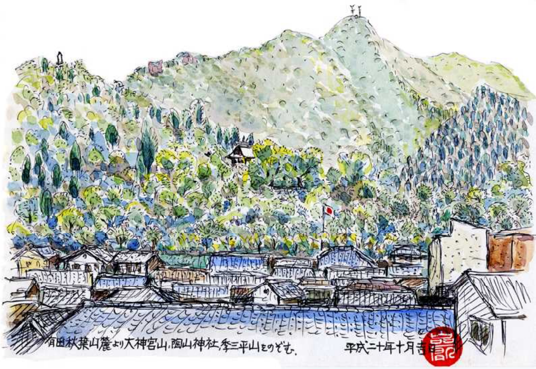
有田秋葉山麓より大神宮山、陶山神社、李參平碑をのぞむ スケッチ 深川 巖氏